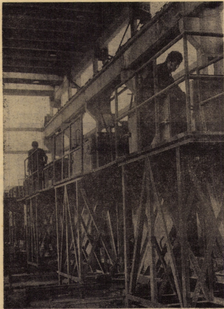
Linia tehnologică pentru băi spațiale, pregătită pentru probe tehnologice la I.C.M.J. Sibiu