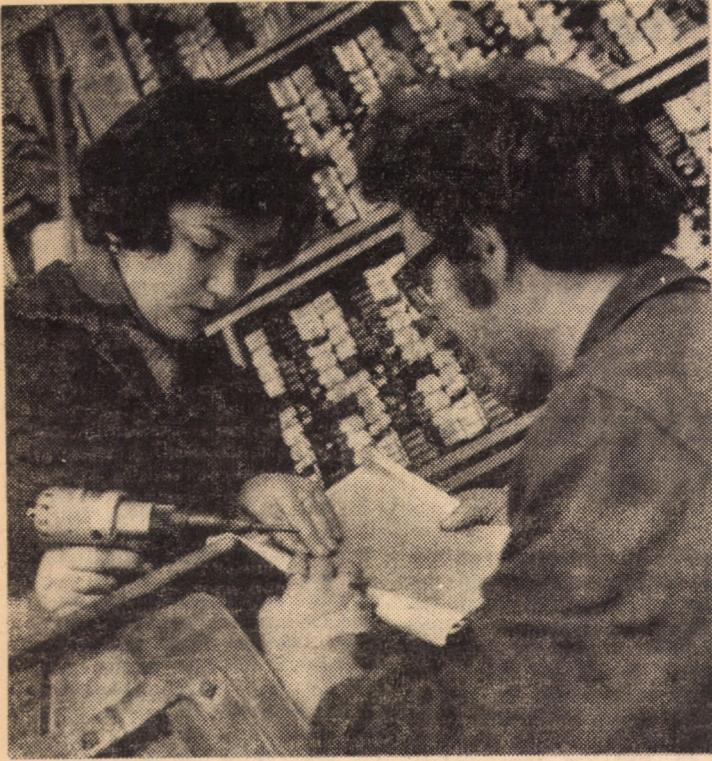
La noua Centrală telefonică automată din cartierul Hipodrom III Sibiu, lucrările de montaj și test continuă într-un ritm susținut