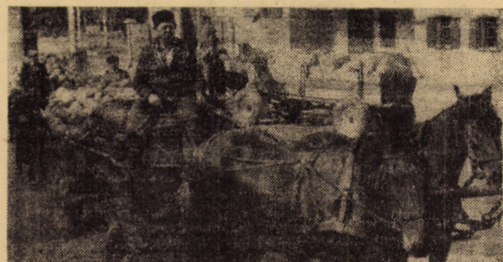
Pentru a grăbi transportul de pe cîmp al recoltei, alături de mijloacele mecanice sînt folosite și atelaje.

România se numără printre țările cu bogate resurse de ape termale. Cercetările din ultimii ani au pus în evidență importante zăcăminte în zona vestică a țării, de la Satu Mare pînă la Timișoara, ca și în regiunea Carpaților orientali, îndeosebi în perimetrul stațiunii Tușnad. Lărgi investigații în această direcție se fac și în Cîmpia Dunării. Pornind de la faptul că izvoarele termale au la suprafața pămîntului, temperaturi de 45-100 grade C, specialiștii au trecut la valorificarea lor.