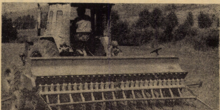
Semănatul grâului, o lucrare care polarizează atenția mecanizatorilor și specialiștilor

De asemenea, a fost terminată și recoltarea sfelei de zahăr de pe cele 2645 ha, aflate în cultură. În atenția unităților agricole rămâne în continuare transportul întregii recolte în bazele de preluare.