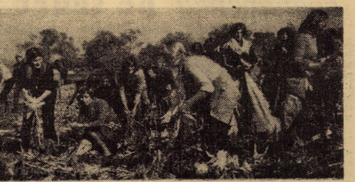
Printre muncitorii ce au venit în ajutorul cooperativelor din Cornăel simț și cele 100 de fete de la căminul de nefamiliști („13 Decembrie”)