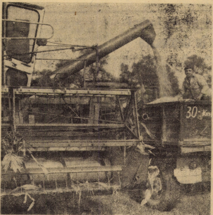
La lucrările de recoltat porumb sînt antrenate și combine C-12. O combină într-o zi înlocuiește munca de recoltat a 35 oameni

tările de la fața locului evidențiază că lucrările premergătoare semănatului se desfășoară în flux, conform indicațiilor. Imediat după arat se execută discuirile, creîndu-se astfel front de lucru celor două semănători SUP 29. Lucrările de sezon fiind întirziate, față de termenele planificate, impun firește accelerarea ritmului pentru finalizarea lor în cel mai scurt timp posibil. În acest sens s-a recurs la cooperarea între secțiile de mecanizare din cadrul aceluiași consiliu unic agroindustrial, soluția dovedindu-se de mare utilitate. De pildă de la S.M.A. Tîrnava a fost adusă o semănătoare SUP 29, de la secțiile din Moșna, Așel și Alma trei combine echipate cu CS 4 M pentru recoltarea porumbului. Revenind la însămînțarea grîului de toamnă putem menționa că lucrarea se apropie de cotele finale.