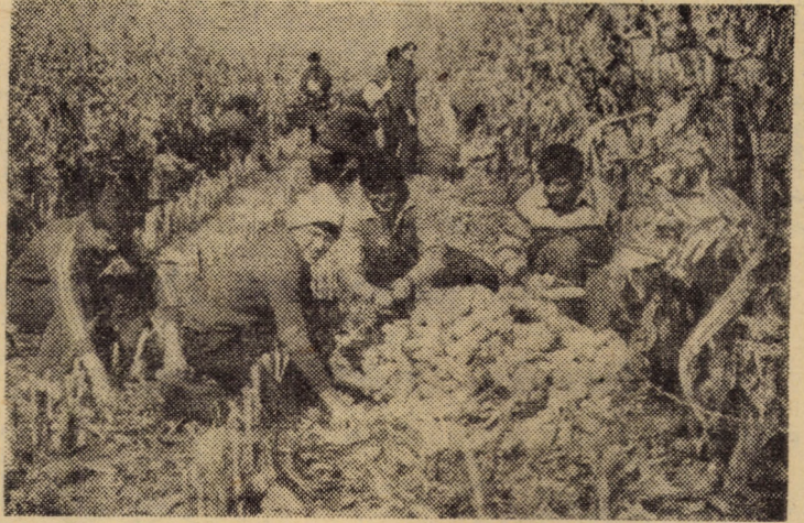
La lucrările de recoltat porumb, ajută atît personal din întreprinderi cît și elevi și studenți

transportului lor din cîmp. În bazele de recepție munca trebuie organizată în două schimburi. Colectivele de oameni ai muncii trimise în ajutor trebuie organizate pe principiile calității și eficienței. Conducerile unităților agricole producătoare trebuie să folosească cu mai multă pricepere rezervele existente în unități, trebuie să militeze cu răspundere pentru ca toate sarcinile din actuala campanie să fie îndeplinite la timp și în mod exemplar.