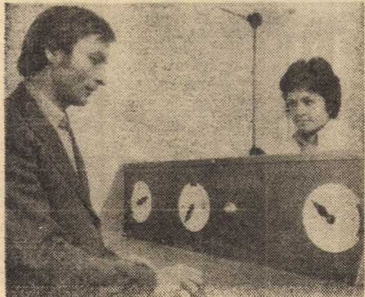
Laboratorul de testare E.T. Sibiu