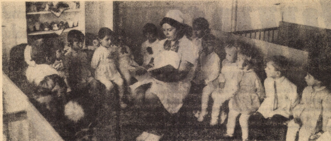
Cărțile cu basme — această lume miraculoasă! (Creșa-grădiniță nr. 29 — cartierul „Vasile Aaron” Sibiu)