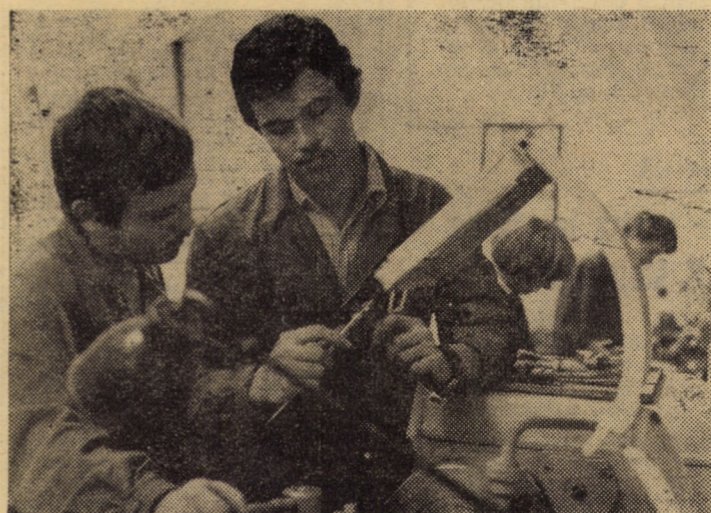
Oră de practică în atelierul de lăcătușerie al Liceului nr. 1 Sibiu

Uniunea societăților de științe medicale, Filiala Sibiu, organizează astăzi, la ora 17, la Clubul Policlinicii de copii din Sibiu, o masă rotundă cu tema „Copilul handicapat în școală”, manifestare cuprinsă în cadrul Sesiunii bianuale de comunicări științifice ale Policlinicii de copii Sibiu sub genericul „5 minute cadredă vă aparține”. Dintre temele puse în discuție amintim: „Bilanțul stării de sănătate a școlărilor din municipiul Sibiu în anul școlar 1978/1979”, „Aspecte privind igiena în școlile generale din municipiul Sibiu”, „Eșecul școlar”, „Recuperarea și reintegrarea în colectivitate a școlărilor cu deficiențe fizice” etc. Va fi prezentat filmul medical „Handicapatul fizic și sportul” (Jocurile Mondiale ale handicapaților fizici, Saint Etienne, 1974).