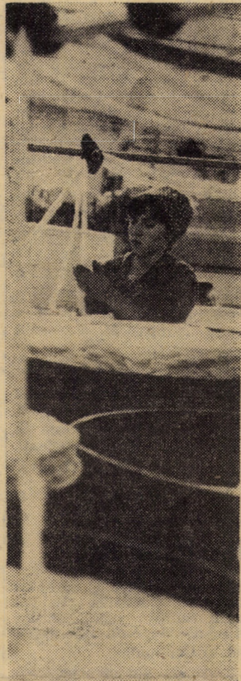
La unul din modernele lăminare ale întreprinderii „11 Iunie” Cisnădie

(Continuare în pag. a IV-a) RADU SELEJAN