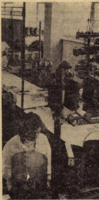
Formație de lucru în sectorul bobinat la întreprinderea de relee Mediaș