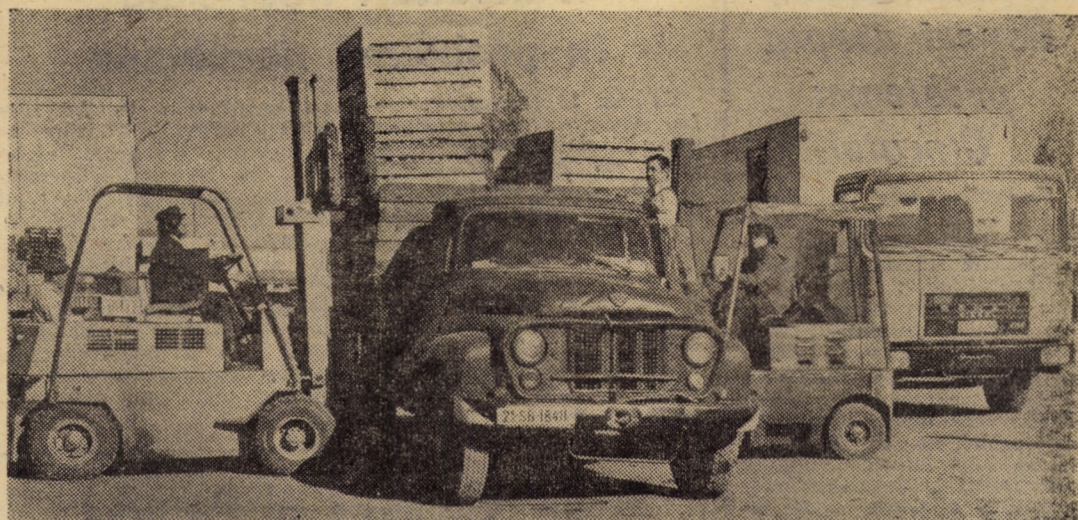
Încărcarea mecanizată a boxpaleților la întreprinderea de legume-fructe Sibiu

...Și astfel, „urcând” de la o secție la alta, adăugându-și noi și noi kilograme, colosul cu nume comun, „întorcătorul de tablă”, a început să prindă contur, să semene tot mai mult cu cel din proiecte. Desigur, acum, văzându-l, oamenii zîmbesc mulțumiți. Dar numai cei care și-au lăsat amprentele pe „pielea” lui, știu cât de greu a fost urcușul. Dar cu atât mai deplină este satisfacția datoriei împlinite. Și oamenii de la „Independența” trăiesc de multe ori pe an asemenea momente de aleasă mulțumire, cu atât mai mult acum, în preajma celui de al XII-lea Congres al partidului, eveniment căruia îi sint dedicate toate succesele obținute în acest firzui de toamnă.