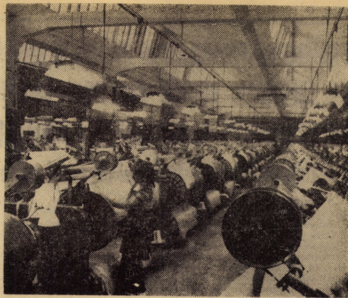
Hala țesătoriei cu mașini pneumatice a întreprinderii „Mătasea roșie” Cisnădie