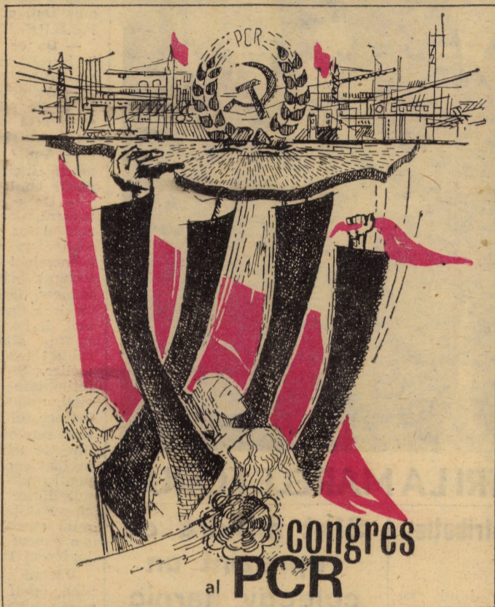
Desen de STEFAN ORTH

O treaptă pe drumul nesfîrșit al glorioasei noastre creații istorice îl constituie Congresul care miine își începe lucrările: Congresul al XII-lea al Partidului Comunist Român — Congresul întregului popor.