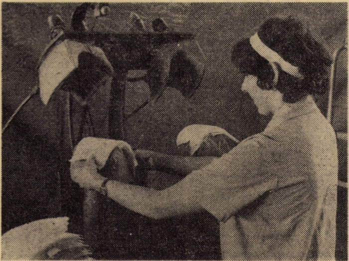
O nouă tehnologie de realizare a pernițelor pentru sacouri și pardesie la secția croit a întreprinderii „Steaua roșie“ Sibiu, la presa de călcat umerii la sacouri prin termocolare — realizată în cadrul întreprinderii — se folosesc deseori rezultate din procesul de croire, obținîndu-se astfel importante economii de materiale

Ca în toate domeniile vieții economico-sociale și în artă și cultură avem stabilit obiective clare, științific gîndite și exprimate. Rămîne acum ca întreg frontul cultural sibiuan să se arate la înălțimea lor.