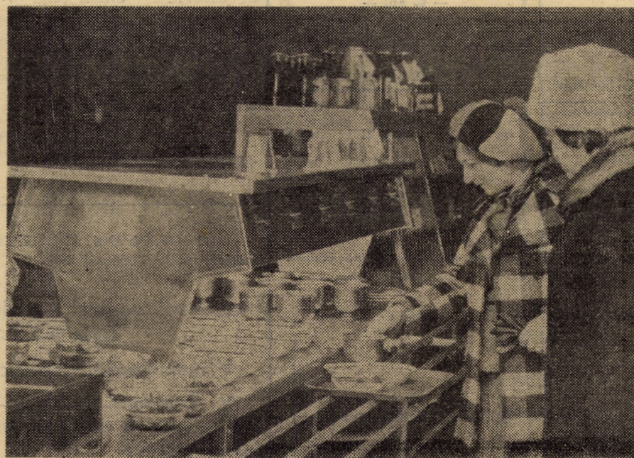
Autoservirea „Expres“ de pe strada 1 Mai din Sibiu — o unitate din ce în ce mai căutată de clienți

Profităm de această ocazie pentru a aduce la cunoștința întreprinderilor care organizează sărbătoarea pomului de iarnă, că pot depune comenzi ferme la unitățile de cofetărie din Sibiu și Cisnădie în vederea confecționării pungilor cu dulciuri.