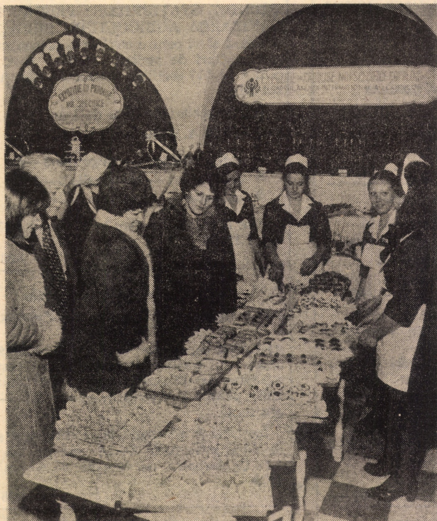
Cofetăria „Perla” este una din unitățile reprezentative ale I.C.S.A.P. Sibiu. Vizitind-o, în aceste zile, vă veți putea procura un bogat sortiment de prăjituri, bombonerie, băuturi răcoritoare, etc.

... A început numărătoarea inversă! De noaptea Anului Nou ne mai despart numai două săptămîni. Luați cu treburile zilnice, cu serviciul, cu curățenia, cu cumpărăturile etc., mulți dintre dumneavoastră ați omis sau pur și simplu n-ați avut timp să vă gândiți unde și cum veți petrece Revelionul. Vă rugăm insistent să nu intrați în panică! De ce? Foarte simplu: