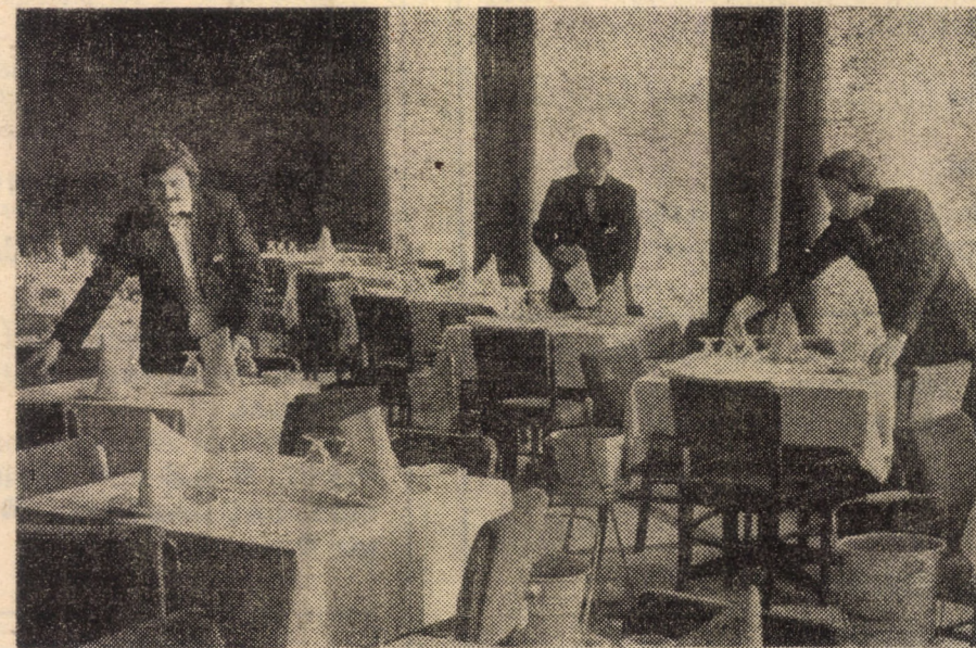
Restaurantul „Sibiul nou” a devenit, grație recentelor lucrări care au avut loc aici, una dintre cele mai moderne și mai ospitaliere unități de alimentație publică din Sibiu. Sperăm să se convingă de aceasta și cei care-și vor petrece Revelionul aici

Așadar, rețineți: și în noaptea Anului Nou, personalul unităților noastre este bucuros de oaspeți. Solicitanții se vor adresa, pentru înscriere,