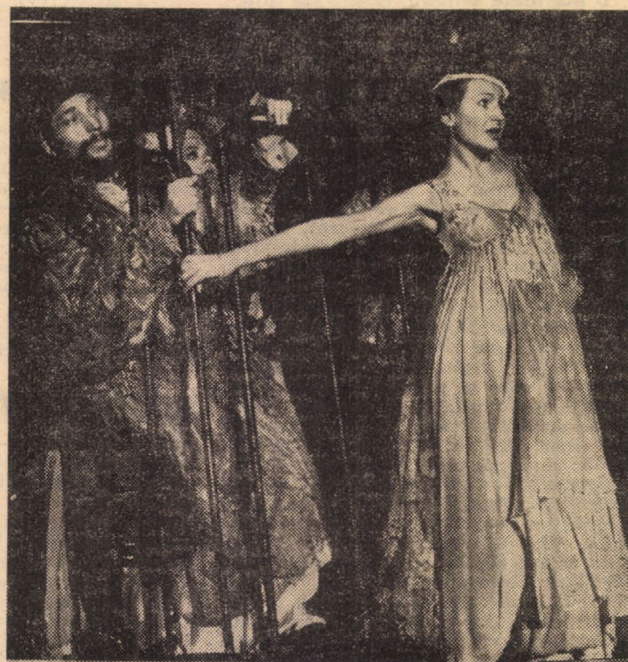
„Răceala” - Scenă din tabăra bizantină

colului) și sincronizare a mișcărilor o impresionantă compoziție de grup, lărgind semnificația meditației. Ca și în A treia țepă, M. Sorescu