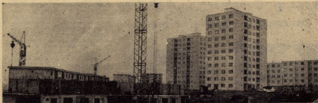
Constructorii sibieni ridică un nou bloc de locuințe în cartierul V. Aaron