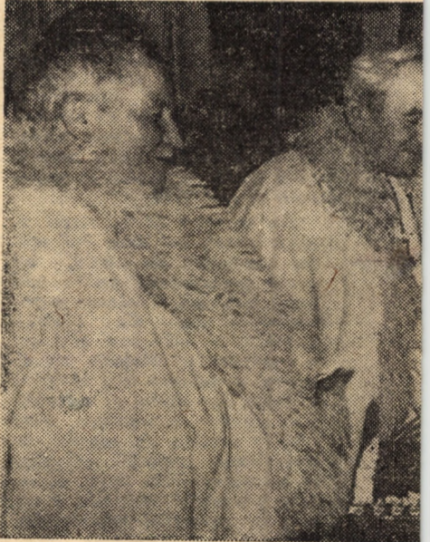
În tradiționalele vestimente ale „Mărgăritori de animale din Tilișca. Sint Ioan în fiecare an, au livrat statului prin...