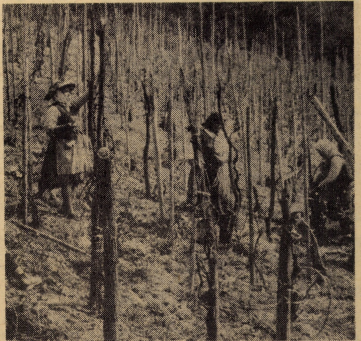
Fiecare clipă prețioasă lucrului în cîmp trebuie folosită eficient pentru urgentarea încheierii lucrărilor agricole de sezon. La C.A.P. Laslea se acționează în spiritul imperativului amintit. Ne-o dovedește secvența fotografică înregistrată pe unul din terenurile cultivate cu viță de vie