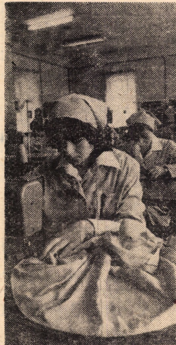
Eleve de la Grupul școlar textil Sibiu în timpul orelor de practică productivă, în cadrul atelierelor-școală