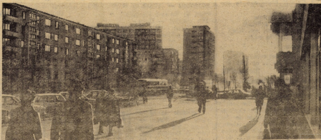
Peisaj în contralumină din cartierul Hipodrom I, Sibiu

Pînă la 1 decembrie a.c., întreprinderea prelucrase 42,2 tone de materii prime recuperabile din resurse proprii, alte 100,2 tone fiind achiziționate de la terți. Numai în țesătoria proprie au fost realizate 300 mii m.p. țesături, utilizîndu-se 52,6 tone fire recuperate.