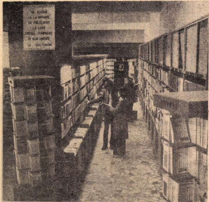
Librăria „Lucaefărul” - una din unitățile de prestigiu din cadrul Centrului de librării Sibiu.