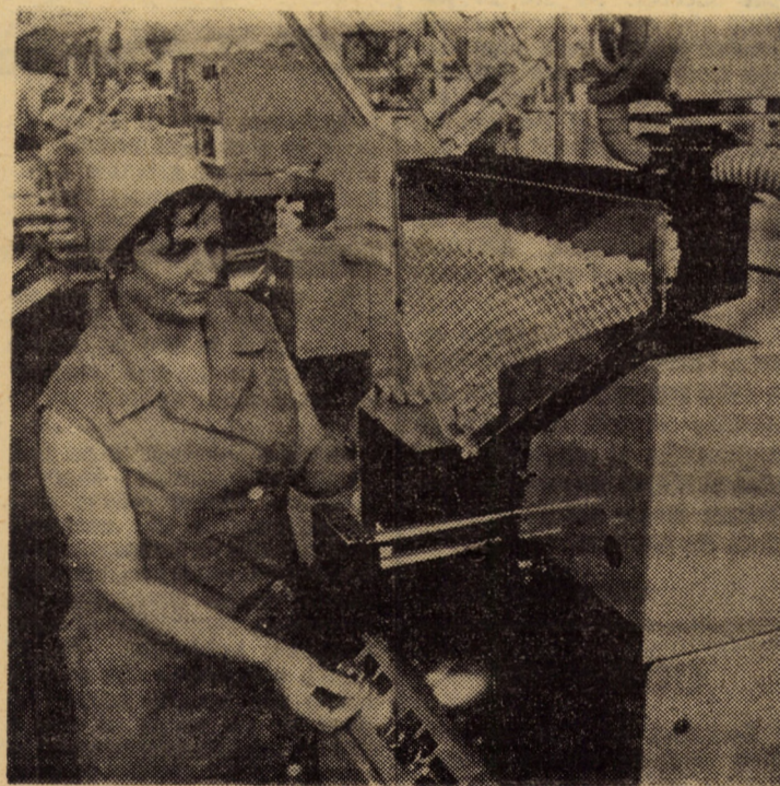
Dintre utilajele moderne, de înaltă tehnicitate din secția finisaj mecanic a întreprinderii „Firul roșu” Tălmăciu: mașina de batirat conic și cilindric