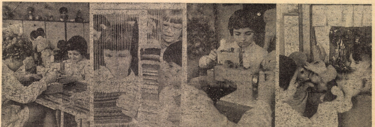
La Grădinița nr. 6 din cartierul Măgura — joaca copiilor e îndreptată de pe acum spre îndeletniciri instructive și educative, utile și pasionante