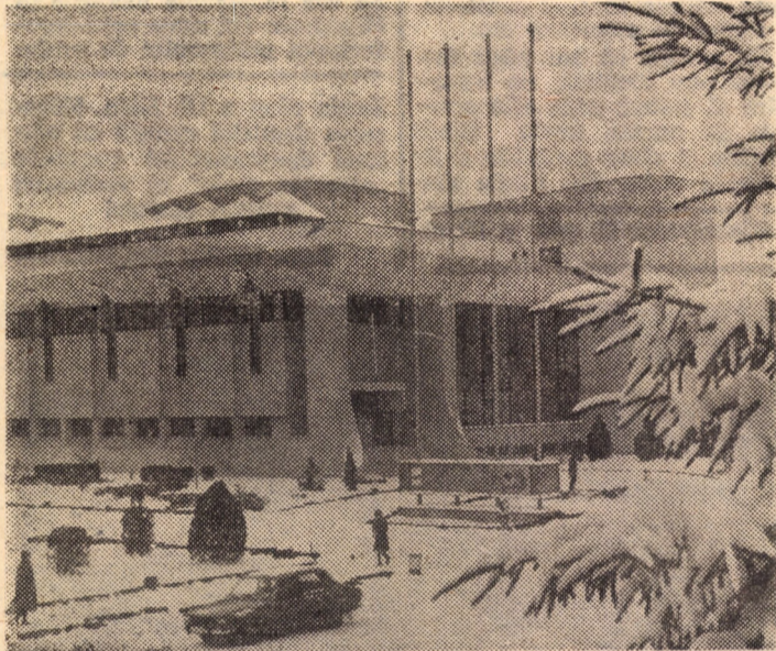
O posibilă ilustrată pe timp de iarnă din Sibiu: Casa de cultură a sindicatelor

● ● ● Știința și contemporaneitatea. Noile realizări în domeniul științei și tehnologiei și aspecte ale impactului lor social. Lucrările sesiunii științifice din 22 februarie 1980 colecția Idei contemporane, editura politică, 380 pagini, lei 12. Dr. Constantin Buga, Protecția muncii, seria Biblioteca juridică a cetățeanului, editura științifică și enciclopedică, 150 pagini, lei 4,75.