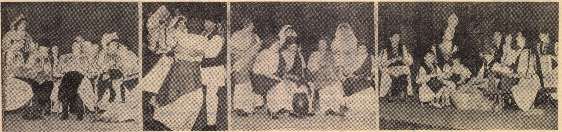
Secvențe din timpul spectacolului din 18 ianuarie: artiștii amatori din Săliște (primele trei imagini, de la stînga la dreapta) și Tilișca (ultima imagine)