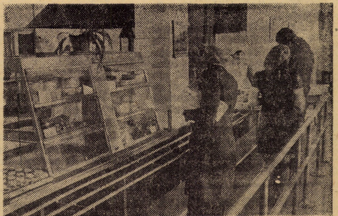
Cantina-restaurant cu linie de autoservire — unitate apartînînd de întreprinderea „Sticla” Avrig — unde zilnic servesc masa peste 500 abonați

În încheierea lucrărilor consfătuirii, participanții au adoptat textul unei telegramme adresate tovarășului Nicolae Ceaușescu, secretar general al P.C.R., președintele Consiliului Național al Oamenilor Muncii.