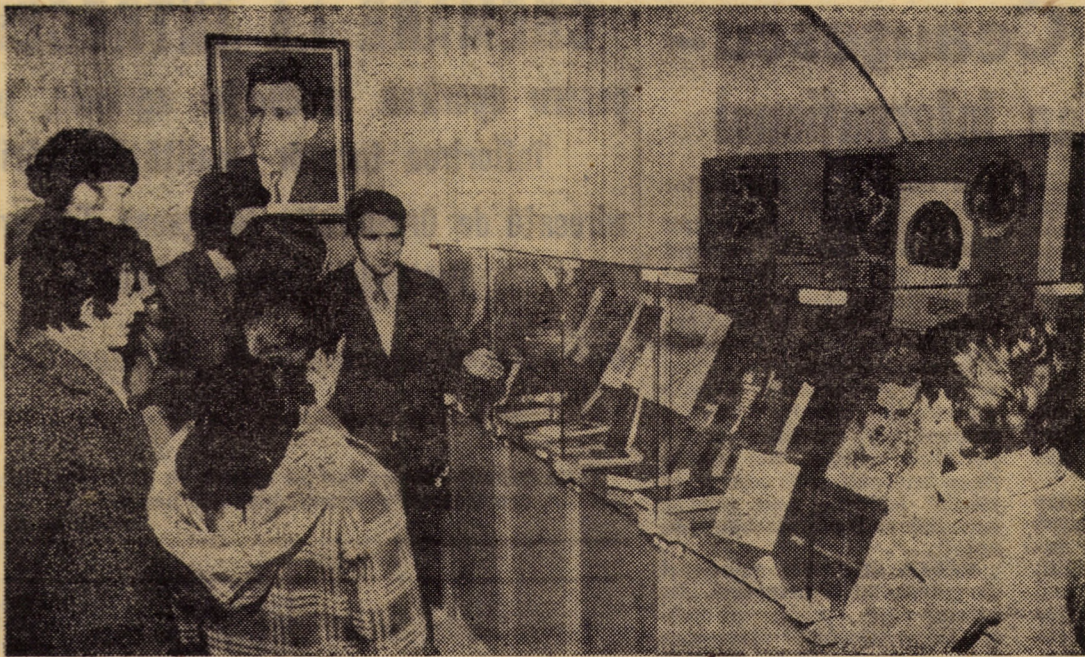
Imagini de la expoziția „Omagiu președintelui Nicolae Ceaușescu” deschisă recent la Muzeul Brukenthal din Sibiu în cinstea aniversării zilei de naștere a secretarului general al partidului