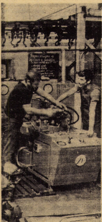
Standuri de probă în secția mecanisme de direcție a I.P.A. Sibiu, pentru verificarea finală a servo-direcției