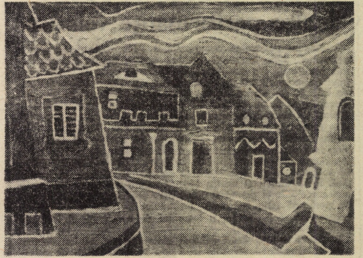
Piața Ursulinelor — Tablou expus alături de alte peisaje sibiene la expoziția de pictură Edit Kasza de la Sala mică a Casei artelor

mătoarelor tehnici: pictură, sculptură, artă decorativă și grafică. Lucrările (maximum trei pentru fiecare din tehnicile amintite) vor fi expediate pe adresa Filialei artiștilor plastici amatori, Mediaș, str. Spitalului nr. 2, pînă la 10 aprilie 1981. Juriul concursului — format din membri ai U.A.P. ai Filialei artiștilor plastici și ai Comitetului municipal U.T.C. — va acorda, pentru cele mai reușite lucrări, premii și diplome, iar cu lucrările reținute va fi organizată o expoziție selectivă în cadrul săptămîinii cultural-artistice „Flori de mai” (3—10.V.a.c.).