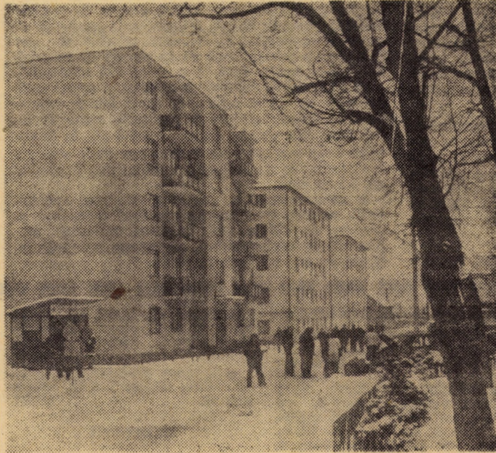
Construcții de locuințe muncitorești pe str. 1 Mai din Avrîg

În funcția de președinte al Consiliului orășenesc al sindicatelor Cisnădie a fost realesă tovarăsa Elena Popa.