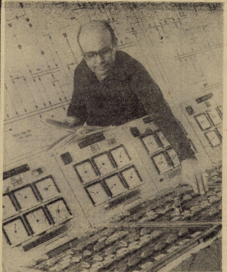
Prin operativitate promptă în acțiune și în urma eforturilor depuse de colectivul compartimentului de distribuție al întreprinderii de rețele electrice Sibiu s-a reușit reducerea cu 1,4 la sută a numărului de intreruperi în alimentarea cu energie electrică, realizându-se totodată însemnate economii. În foto: aspect din activitatea coordonatorului de manevre

baterii, așa că am selectat doar trei dintre ele, unde s-ar putea găsi un teren fertil de desfășurare a forțelor sindicaliștilor copșeni. 1. Efectele pozitive ale aplicării noului mecanism economico-financiar s-au făcut din plin simțite pe platforma industrială Copșa Mică, dar rezultatele obținute în folosirea capacităților de producție, reducerea consumurilor și valorificarea superioară a materiilor prime și materialelor, deși unele sînt bune, luate în amănunt nu reflectă adevăratele disponibilități. S-ar putea, deci, ține mai mult cont de faptul că, prin cuprinderea