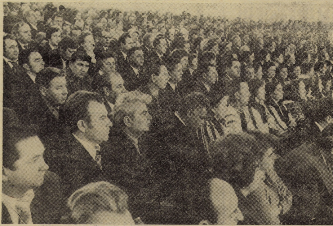
Participanți din județul Sibiu la cel de-al II-lea Congres al consiliilor de conducere ale unităților agricole socialiste, al întregii țărâni, al consiliilor oamenilor muncii din industria alimentară, silvicultură și gospodărirea apelor