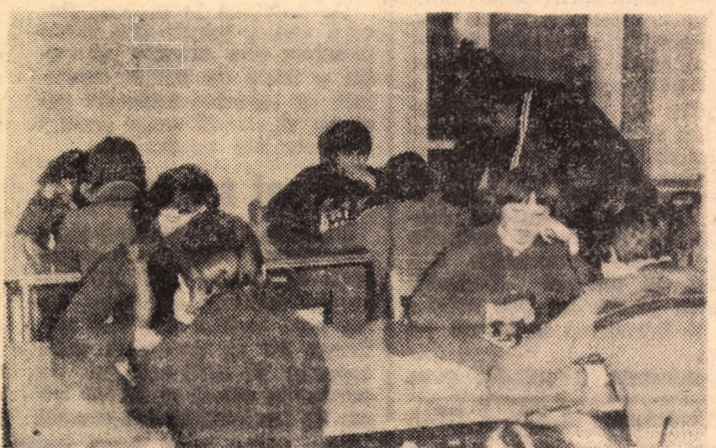
Aspecte de la faza județeană a „Daciadei” (etapa de iarnă)

În repriza secundă, în echipa oaspete au loc mai multe înlocuiri, jocul se leagă ceva mai bine, două dintre numeroasele situații favorabile fiind concretizate de S. Marcu și Galaț. Textiliștii au dat o replică viguroasă mai valorosului partener, dar n-au izbutit să înscrie nici din lovitură de la 11 m (min. 81), Negru apărînd șutul lui Manaitu.