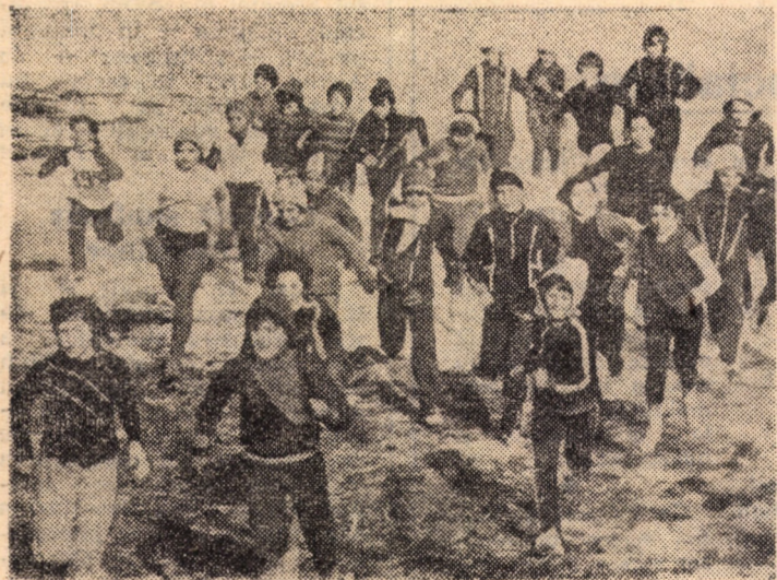
Viitoarele atlete se întrec deocamdată, în proba copiilor cat. II. Aspect din etapa județeană a Campionatului național de cros