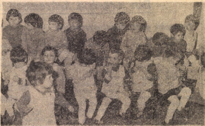
Lăudabilă inițiativă! Sîmbătă, membre ale comitetului de Cruce Roșie și ale comisiei de femei de la Institutul de învățămînt superior au oferit tradiționalele mărțișoare micuților de la Casa de copii preșcolari din Sibiu. Un gest frumos, cu deosebite semnificații...