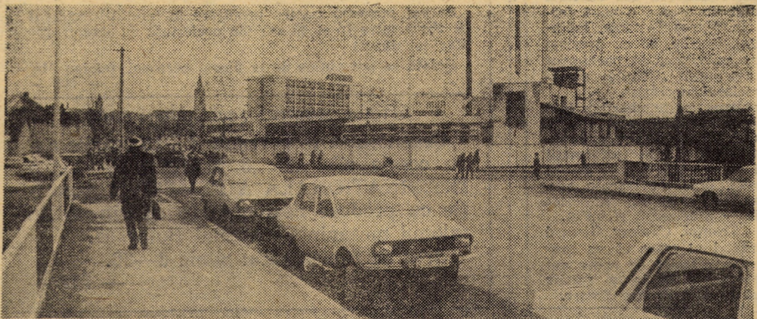
Imagine din zona industrială a „orașului de jos”, a Sibului văzută de pe noul pod peste riul Cibin care deocamdată servește drept parcare pentru autoturisme. Cînd se va putea circula normal și prin acest punct de mare trafic?

• urmări din pag. 1 • urmări din pag. 1 • urmări din pag. 1 • urmări din pag. 1 •