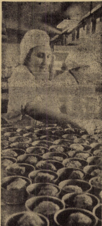
Pregătirea conservelor pentru faza închidere la I.C. Sibiu