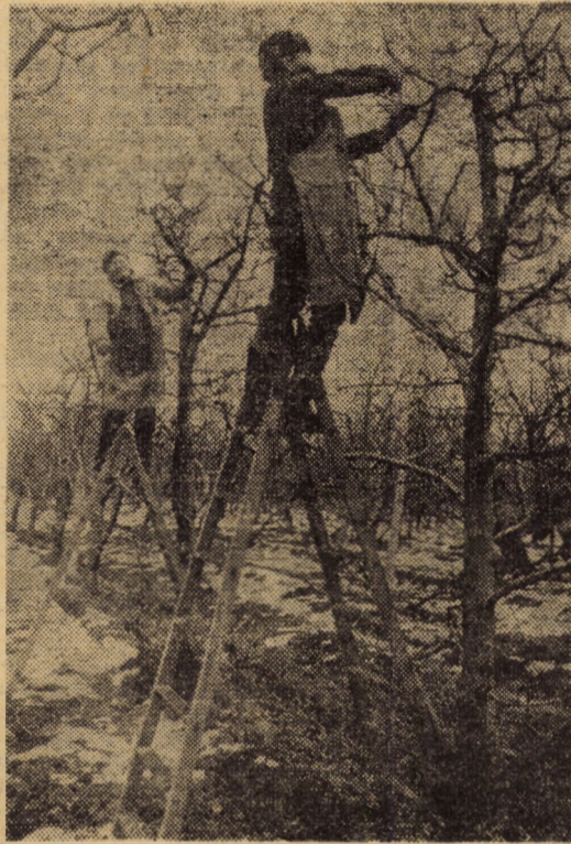
Intr-una din livezile I.A.S. Apoldu de Sus, echipa condusă de Nicolae Părăian lucrează intens la tăieri de pomi.

(Continuare în pag. a III-a) NICOLAE ACHIM