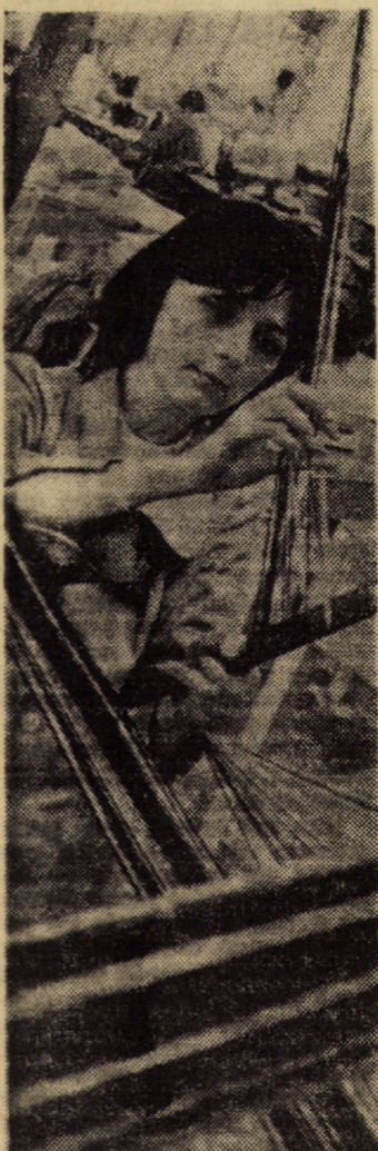
Pregătirea urzelii pentru războaiete de țesut manuale în atelierul covoare și stofe de casă al cooperativei „Arta Sibiului”