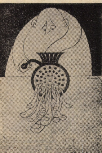
Desen de RUDI SCHMUCKLE