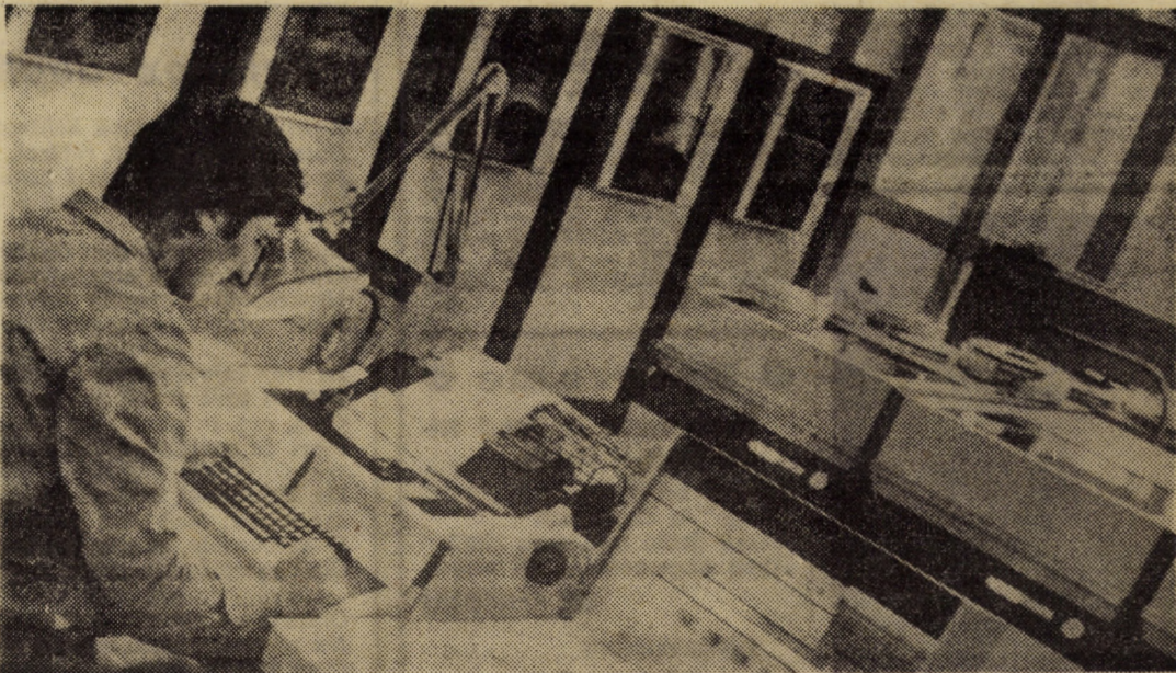
Informația devine, de la o zi la alta, un instrument indispensabil procesului complex de conducere și organizare a activității economice. Centrul teritorial de calcul electronic Sibiu confirmă cu fiecare nou pas înainte pe calea implementării informaticii în producție necesitatea imperioasă ca aceasta să îmbrace în toate împrejurările „hainele sale de lucru”

Dintre orașele cu mai puțin de 10 000 de locuitori, pe primul loc s-a clasat orașul Copșa Mică, iar dintre orașele cu peste 10 000 de locuitori, pe primul loc s-a situat orașul Dumbrăveni. Rezultatele obținute de consiliile populare orașenești fruntașe pe județ precum și rezultatele celor două consilii populare municipale — Sibiu și Mediaș — sînt propuse spre a participa la întrecerea socialistă pe țară.