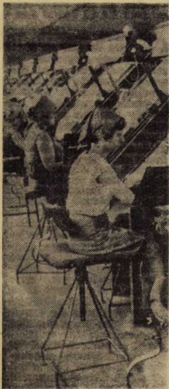
O ultimă „paradă” a țesăturilor pe rampele de control, în fața privirilor exigente ale muncitorilor compartimentului C.T.C. de la întreprinderea „Tirnava” Mediaș