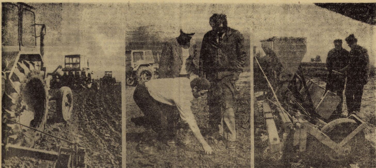
Folosind din plin timpul prielnic, în aceste zile mecanizatorii de la Consiliul unic Șeica Mare lucrează cu toate forțele la însămințatul sfeclei de zahăr. Astfel, în locul denumit „Dealul podului”, cu 12 semănători au fost însămințate într-o singură zi cca 60 hectare