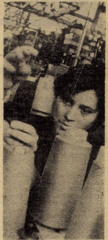
Secvență de lucru din secția tricotat ciorapi a întreprinderii de mînuși și ciorapi Agnita