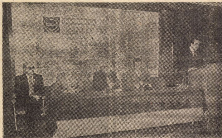
Aspecte de la ședința inaugurală a „Colocviilor de critică - ediția a V-a” - organizate de revista „Transilvania”

Colocviile de critică ale revistei „Transilvania”