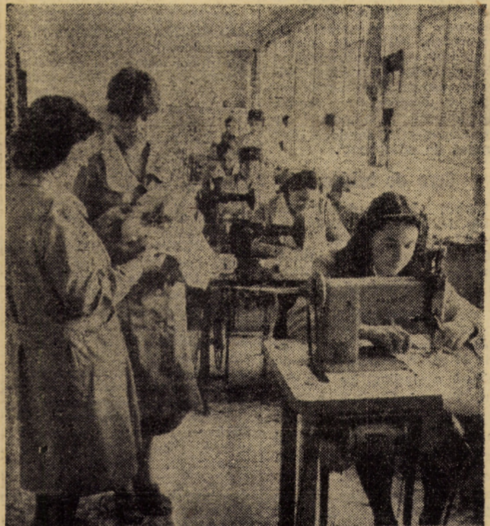
Intr-una din spațioasele încăperi de la Casa modei din Sibiu (Piața Unirii) funcționează și o croitorie artizanală, aparținînd cooperativei „Arta Sibiului”

(Continuare în pag. a III-a) NICOLAE IVAN