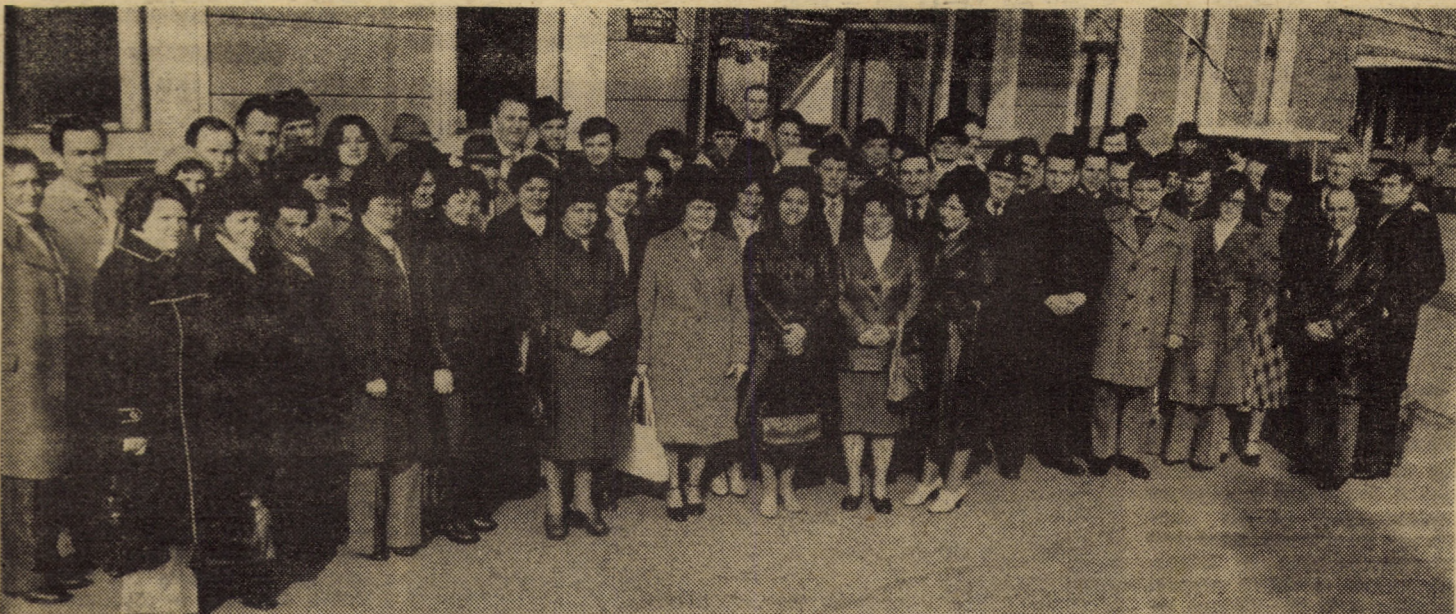
Delegația județului Sibiu, participantă la Congresul Uniunii Generale a Sindicatelor din România