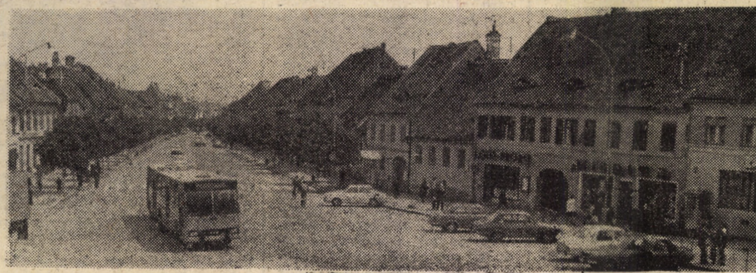
Imagine din centrul orașului Cisnădie