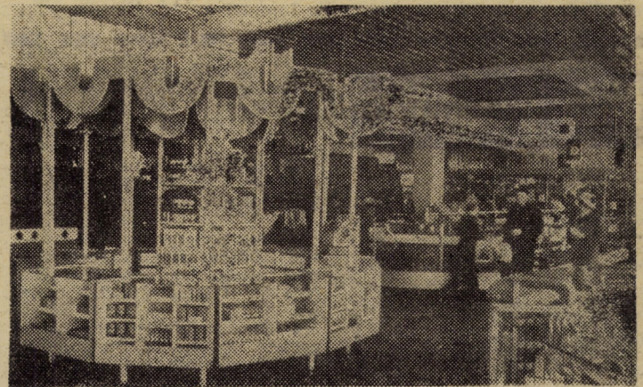
Magazinul „Dumbrava” Sibiu. Vedere parțială — parter

Să se fi „moleșit” într-atît spiritul civic al sibienilor? Să nu dorească ei să facă, asemenea bunului gospodar, tot ce știu, pot și simt că trebuie să facă pentru primeni-