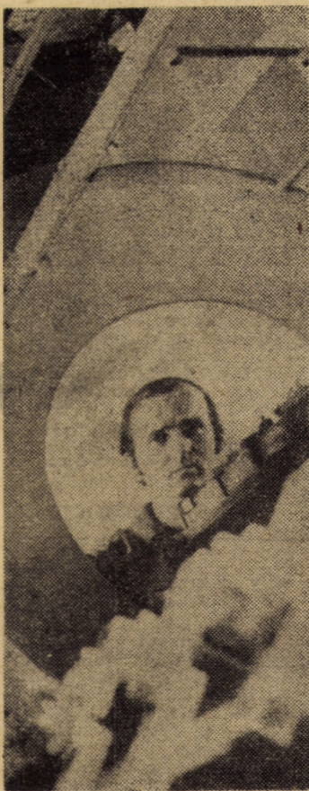
Muncă susținută, eforturi amplificate — iată devisa acestei luni și la întreprinderea de geamuri Medias.

În zilele mai sus menționate chioscurile pentru vînzarea biletelor vor fi închise, personalul de aici fiind folosit la efectuarea sondajului. Atenție deci și la procurarea din timp a biletelor de călătorie!