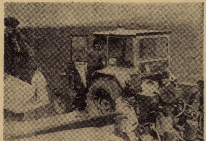
C.A.P. Ocna Sibiului Șeful de brigadă, Opreșor Simion, are grijă ca alimentatul semănătorilor să dureze cît mai puțin.