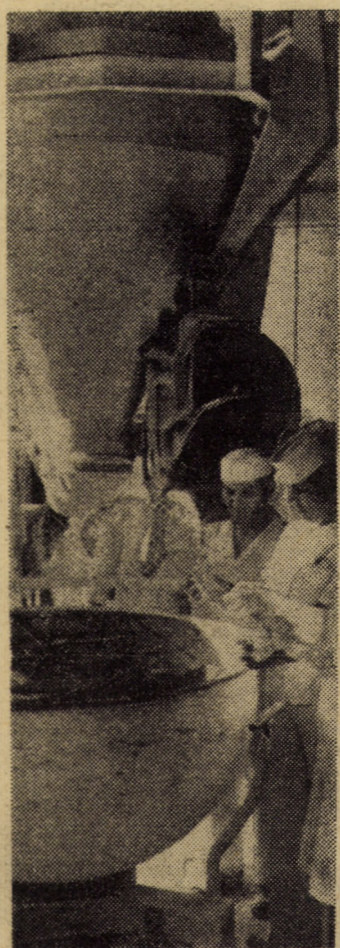
Aspect din sala malaxoarelor a întreprinderii de panificație din Mediaș unde lucrătorii acestei unități se străduiesc să realizeze o pâine de bună calitate