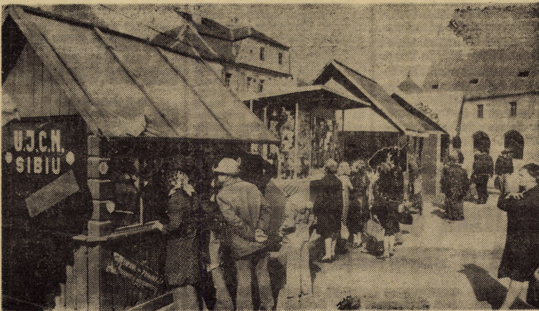
Zilele trecute, în Piaţa 6 Martie din Sibiu a fost deschis Tîrgul de primăvară al Cooperăţiei meşte-sugăreşti Sibiu