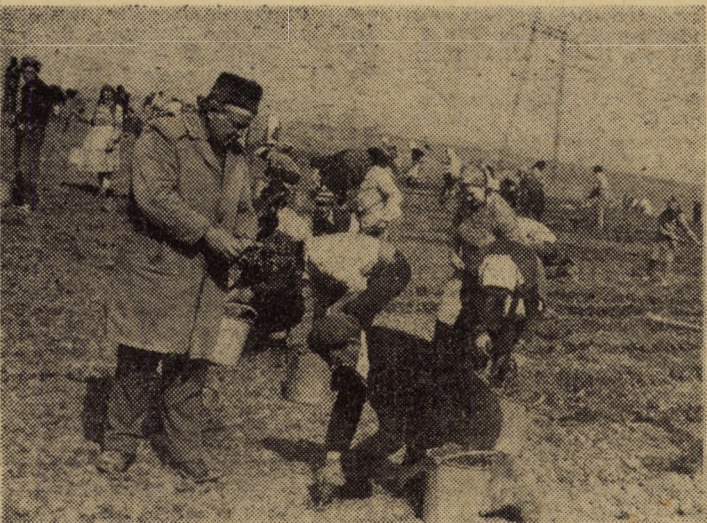
Plantatul puietilor în ferma pepinieră de la Șura Mică

Dar tot aici, în ferma pepinieră de la Șura Mică, se produc puietii și pentru gospodăriile populației. În această primăvară s-au vîndut pentru grădinile cetățenilor peste 28 000 meri, pruni, peri și vișini. Iar pentru cei care n-au aflat încă, îi informăm că puietii pot fi cumpărați și direct de la fermă.