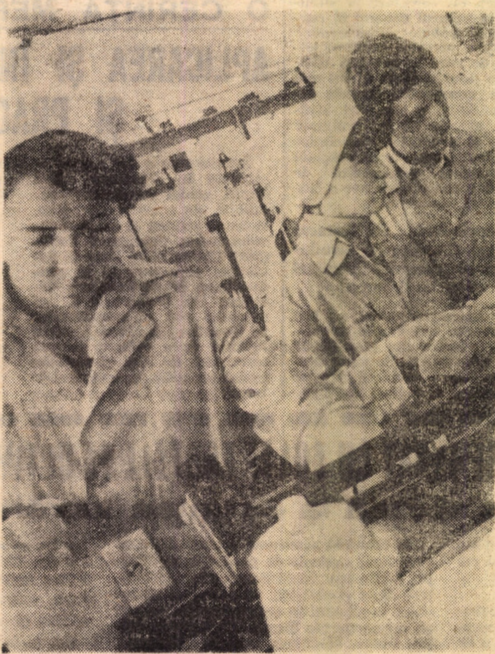
În acest an școlar atelierele productive ale Liceului industrial textil Sibiu au fost dotate cu o serie de utilaje în valoare totală de cca 250 000 lei, asigurîndu-se astfel condiții optime pentru desfășurarea orelor de practică productivă a elevilor.

MUNCĂ PATRIOTICĂ. • Joi, 23 aprilie, șoimii patriei de la Casa pionierilor și soimilor patriei Săliște prezintă programul artistic „Creștem odată cu țara” pe care îl dedică pionierilor care au realizat pînă în prezent 70 la sută din angajamentul de muncă patriotică. • În aceste zile pionierii de la școlile generale din Selimbăr, Arpasu de Jos, Birghis, nr. 12 Sibiu, Săliște, Brateiu, Turnu Roșu, Lasleș, Dirlos participă la curățarea pășunilor, plantări de pomi fructiferi și puieți de brad, amenajări de zone verzi. (C. Angela).