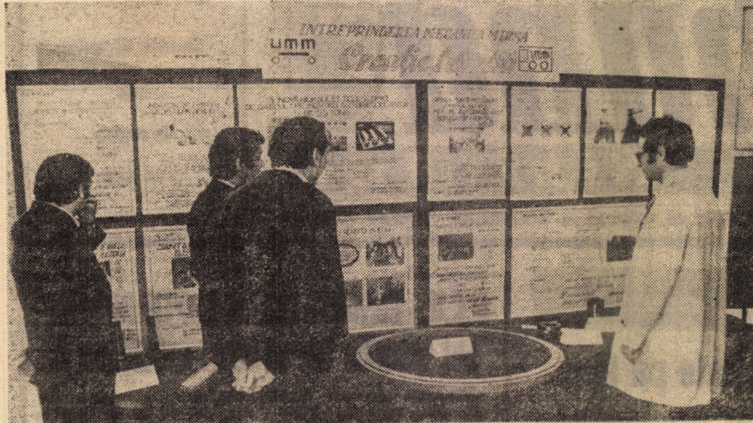
Creaţia tehnică la I.M. Mirşa este un subiect permanent „fierbinte”, dovada cea mai concludentă constituind-o impresionantul şir de premiere tehnice care s-au realizat în ultimii ani aici, toate inscriindu-se pe coordonatele eficienţei şi competitivităţii