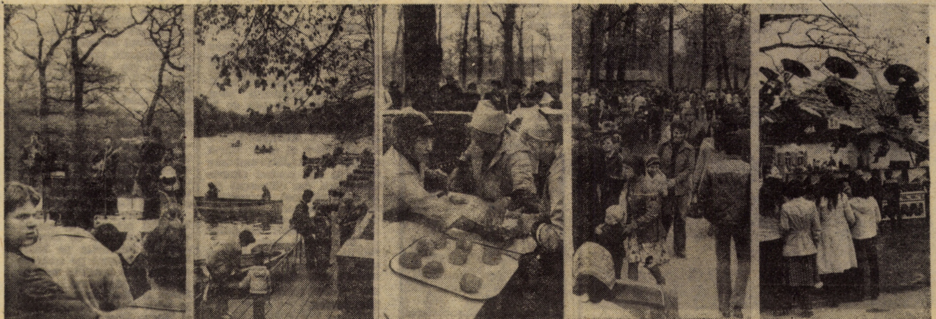
Dumbrava Sibiului — locul preferat al sibienilor pentru a-și petrece ziua de 1 Mai