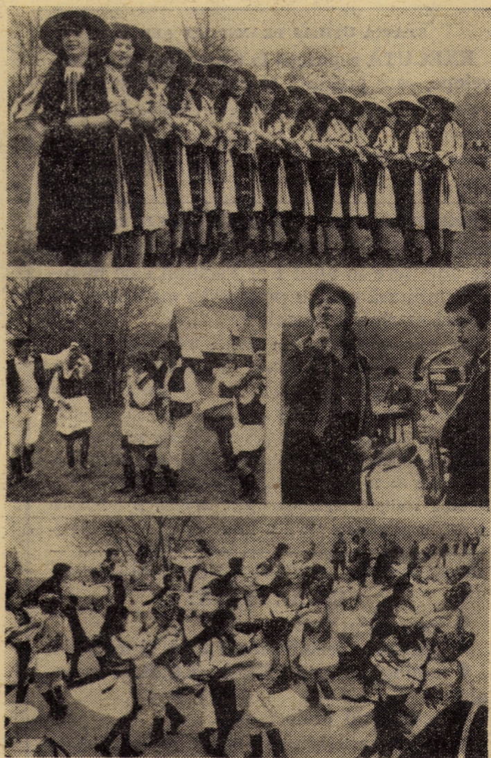
2 Mai — Ziua tineretului. Formații de cîntece și dansuri populare din diferite localități ale județului au prezentat un reușit spectacol în aer liber, în incinta Muzeului tehnicii populare din Dumbrava Sibiului.