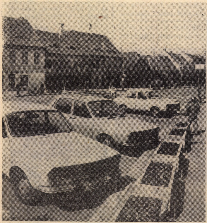
Centrul orașului textiliștilor — Cistădie