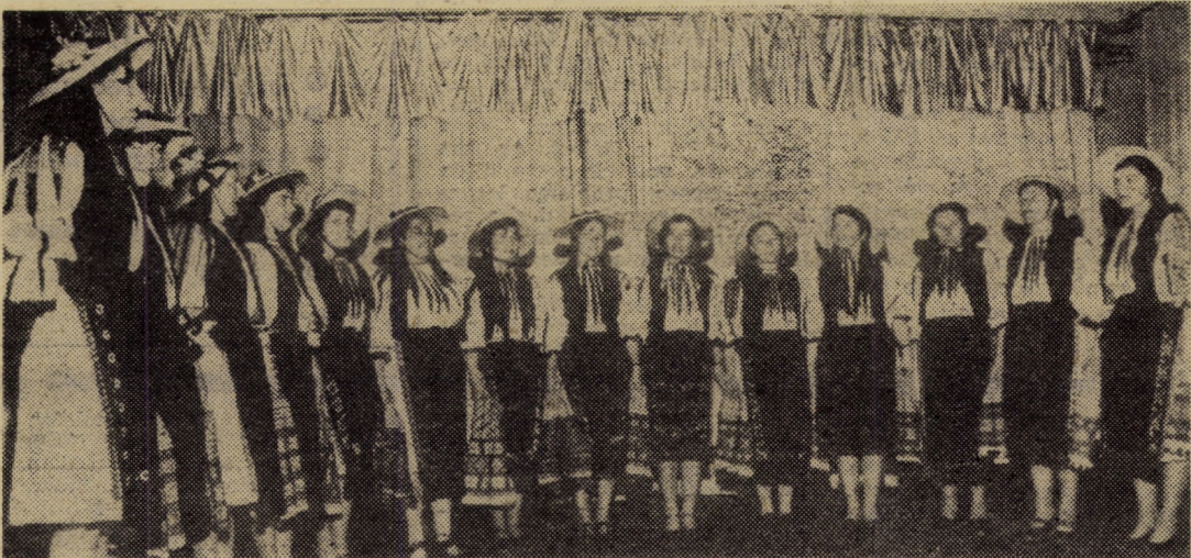
Moment din spectacolul prilejuit de festivitățile de la Porumbacu de Jos