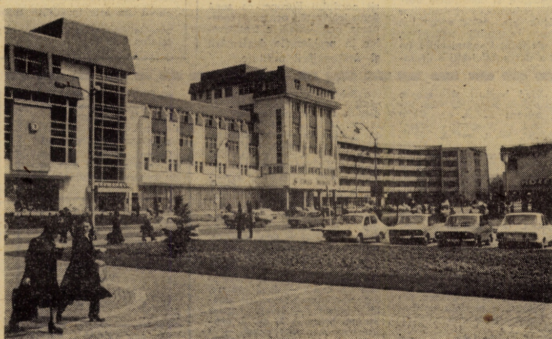
Sibiu zilelor noastre: Piața Unirii