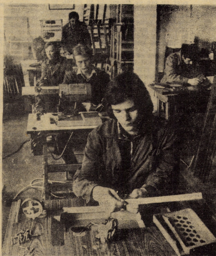
Fabrica de utilaje și accesorii Agnita. Linia de montaj mese mașini cusut