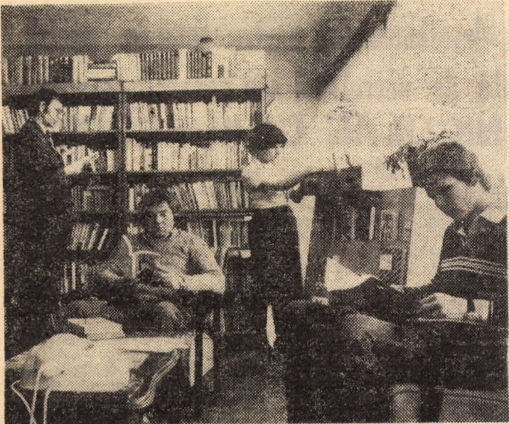
La biblioteca clubului sindicatului I.M.M.N. Copșa Mică, numărul cititorilor, de la începutul anului și pînă în prezent, se ridică la peste 1700, cu cca 15 000 cărți citite.