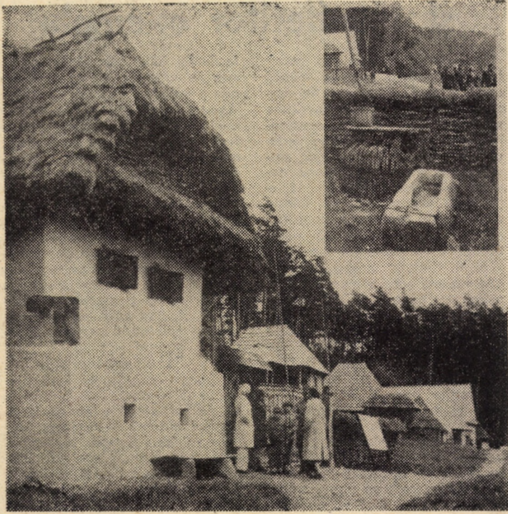
Unul din obiectivele de dată mai recentă, prezentat vizitatorilor Muzeului tehnicii populare din Dumbrava Sibului: gospodăria de prelucrare a cîniei și atelier de funar din Săsăuși, comuna Chirpăr, județul Sibiu